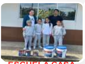
ESCUELA CASA VIEJA