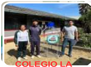
COLEGIO LA VICTORIA