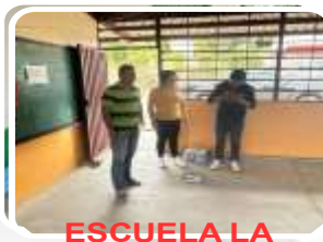
ESCUELA LA BOCANA