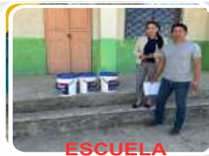
ESCUELA TORIBIO MORA